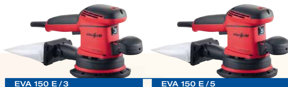
EVA 150 E / 3